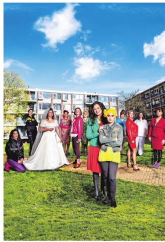
De hoofdrolspelers van 'Zij'.

bij locatievoorstelling 'Zij' op de Bossche immigrant